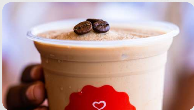
Granizado de Café