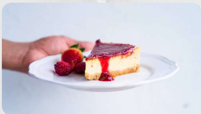
Cheesecake frutos rojos