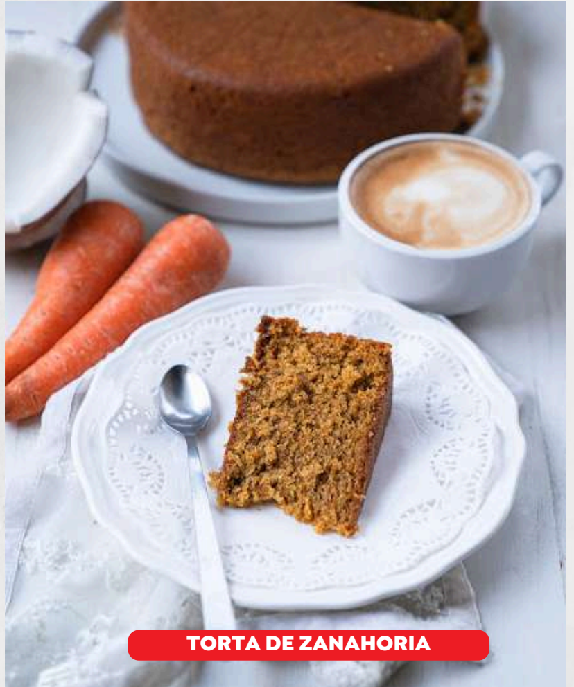
TORTA DE ZANAHORIA