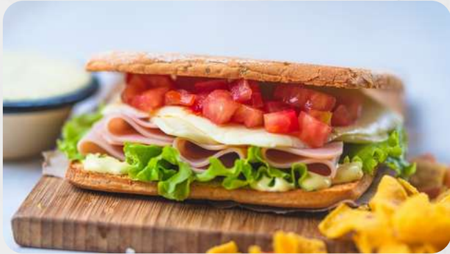
Sandwich de la casa