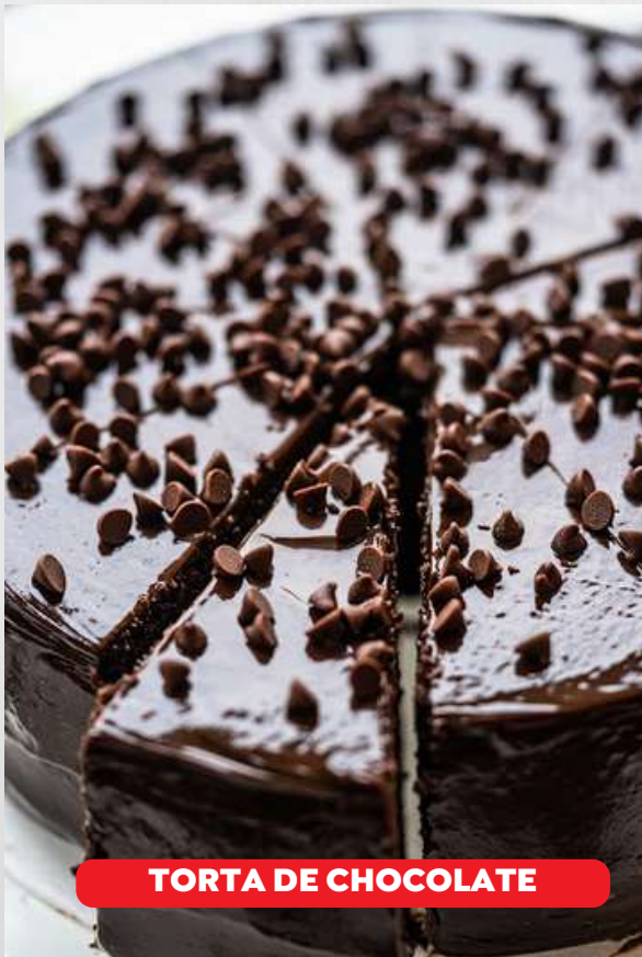
TORTA DE CHOCOLATE