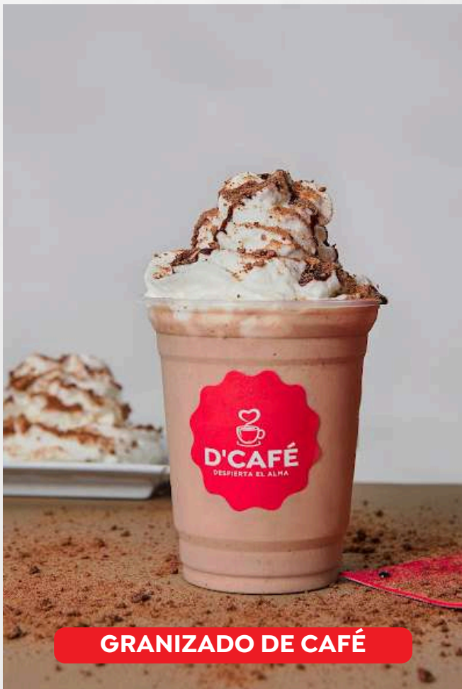
GRANIZADO DE CAFÉ