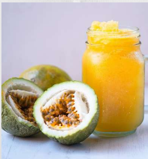
GRANIZADO DE MARACUYA