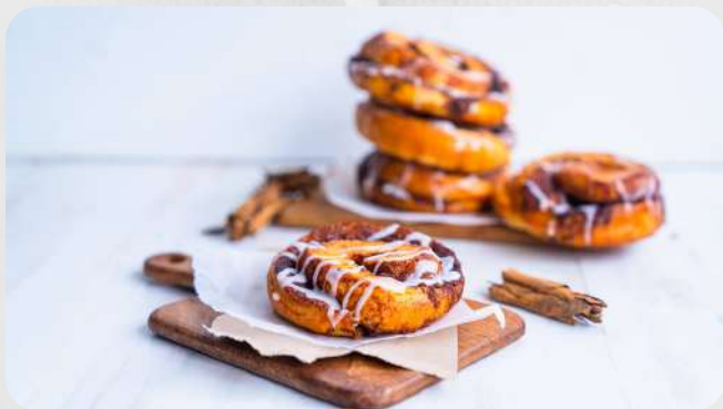
Rollo de canela