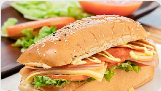
Sandwich súper especial