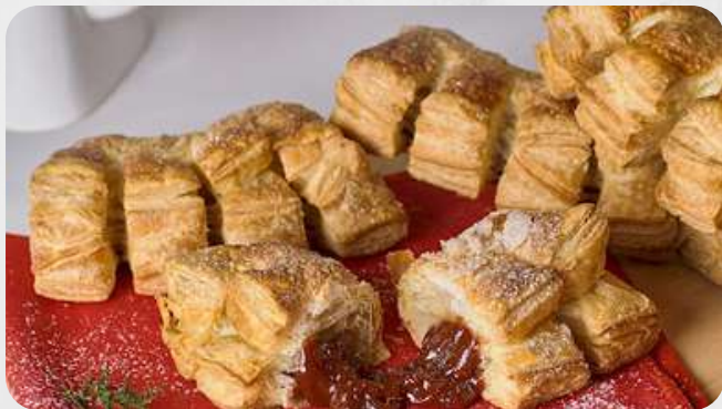
Chicharrón de Guayaba