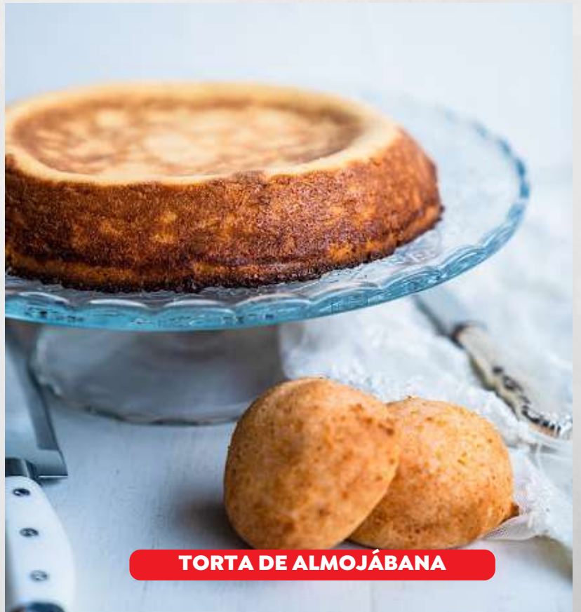
TORTA DE ALMOJÁBANA