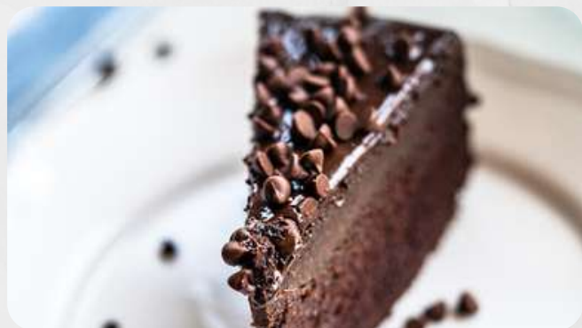
Torta de Chocolate