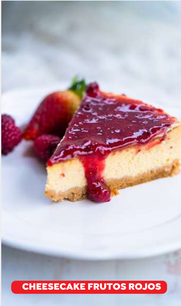
CHEESECAKE FRUTOS ROJOS