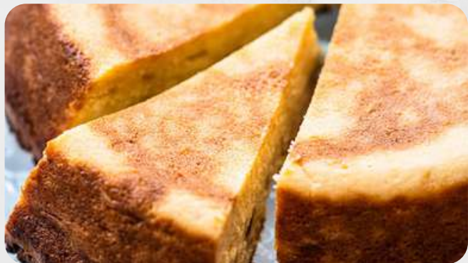
Torta de almojábana