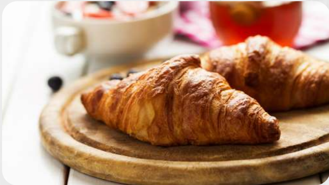
Croissant de queso