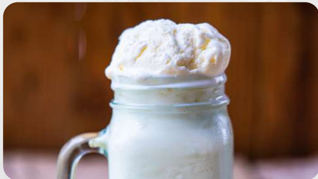
Malteada de Vainilla